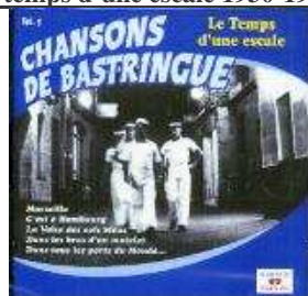
Ref BL-MA-012 : 9.95 €